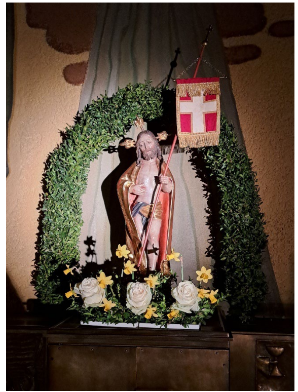
Bild: Auferstandener Kirche Eggingen

Wir laden Sie zu unseren Festgottesdiensten am Hl. Triduum (Gründonnerstag, Karfreitag und Ostern) herzlich ein. Feiern Sie mit uns und schöpfen Sie Gottes Kraft für alle Herausforderungen Ihres Lebens.